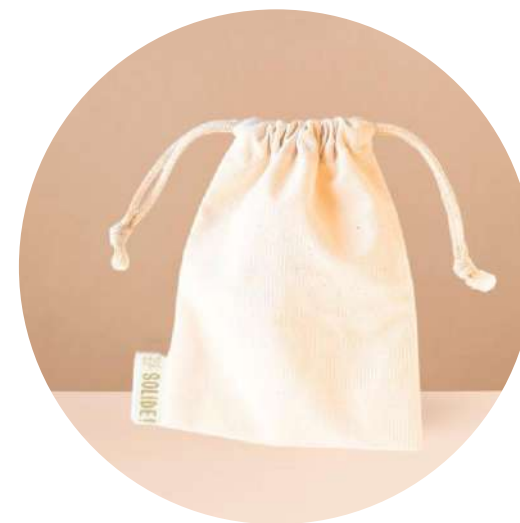
LA POCHETTE DE TRANSPORT SAVON & COSMÉTIQUES