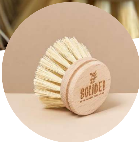
TETE DE RECHANGE

La tête de rechange de la brosse vaisselle à manche en bois est vendue séparément : conservez le manche et changez la tête lorsqu'elle est trop usée.