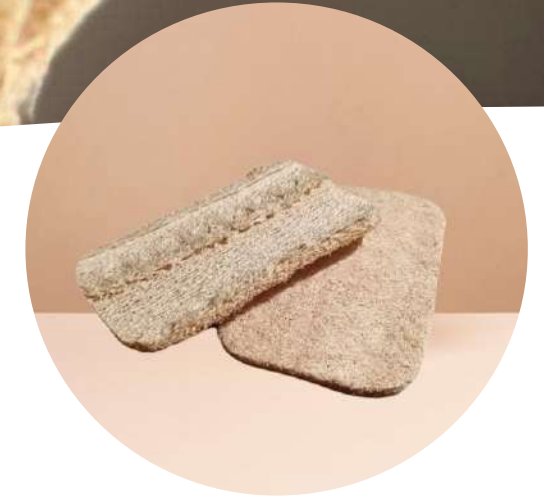
TRANCHE DE LOOFAH

Aucune transformation : il s'agit d'une simple tranche de loofah , comprimée et découpée. Très pratique pour faire la vaisselle, frotter et récurer. Très économique, 100% naturel et compostable