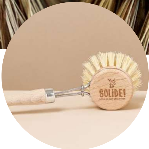
BROSSE MANCHE BOIS

En bois certifié FSC/PEFC – fabriquées en Allemagne