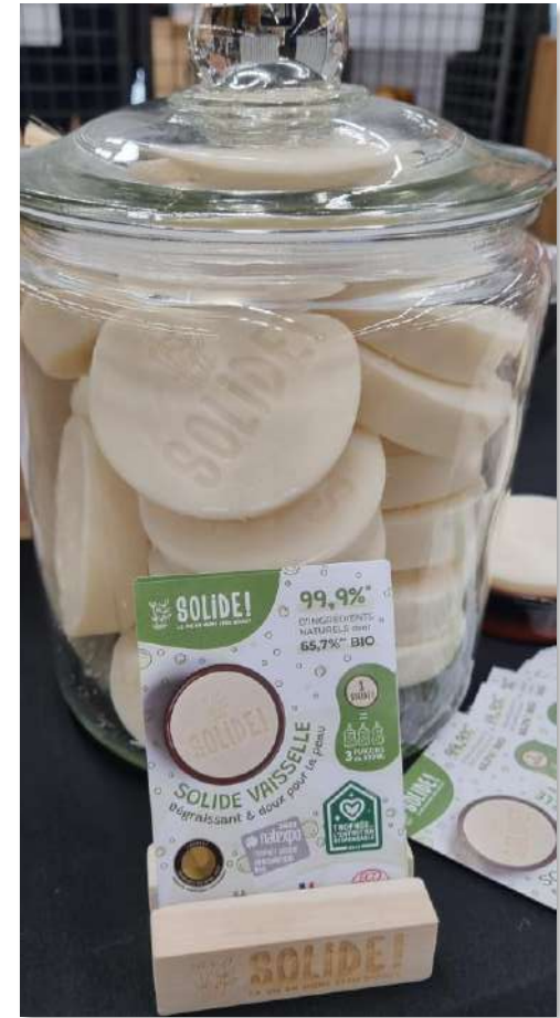
Suggestions de présentation

Fabriqué en France à partir d'ingrédients d'origine naturelle (99,97%) dont bio (65,6%) et certifié écodétergent à base d'ingrédients bio par ECOCERT