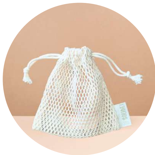
LE FILET SAUVE SAVON