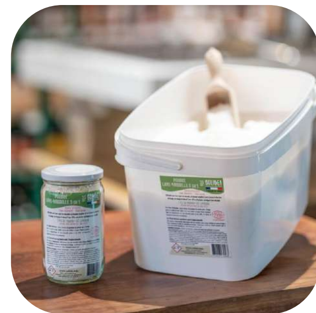
Suggestion de présentation

Ingédients : 15 % ou plus mais moins de 30 % : agents de blanchiment oxygénés. Moins de 5 % : agents de surface non ioniques. Contient aussi : correcteur d'acidité, sels de carbonate, silicates, séquestrants, enzymes : moins de 5%.