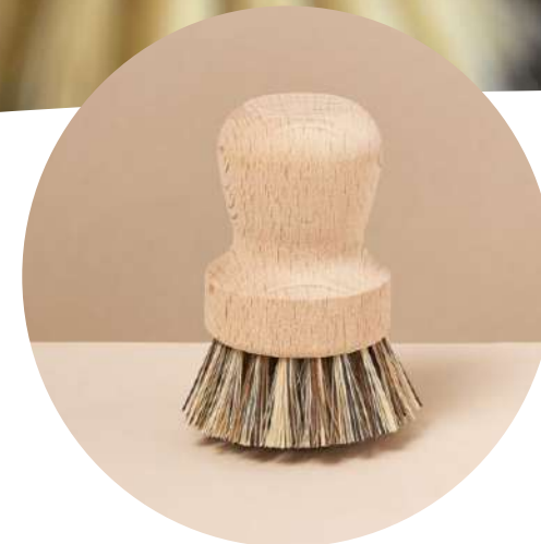
BROSSE BOULE BOIS