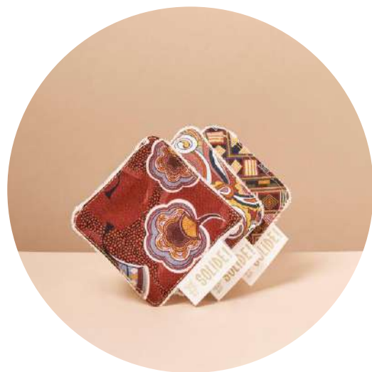
LES CARRES DEMAQUILLANTS

Fabrication à la main, en France, par des travailleurs en situation de handicap, en ESAT et ateliers d'insertion, avec 100% de tissus en COTON BIO certifié GOTS (compris fils de couture et étiquettes), Cordons en coton naturel non traité et tissé en France